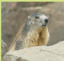
SUBIMOS ACOMPAÑADOS DE NUMEROSAS MARMOTAS