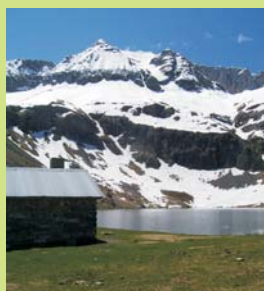
REFUGIO Y LAGO SABOCOS ( 1905 M ALT.)