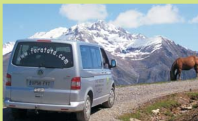
MIRADOR FRENTE AL MANDILAR PICO ARGUALAS (3046M ALT.)