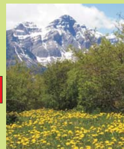
IMPRESIONANTES VISTAS SOBRE LA SIERRA DE LA PARTACUA PEÑA TELERA (2764 M ALT.)

CAPACIDAD : HASTA 8 PERSONAS, MÍNIMO 5 PAX. POR EXCURSIÓN ADAPTACIÓN SILLA DE RUEDAS