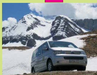
PARADA EN EL IBON DE LOS ASNOS (2060 M ALT.)