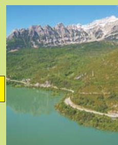
A 1000 METROS ENCIMA DEL EMBALSE DE BUBAL